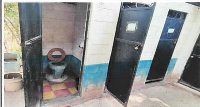
Foto 3: Se observa que los servicios sanitarios están deteriorados, aún tienen taza de cemento (letrina), sólo funcionan dos.