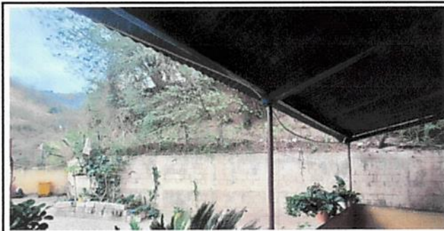
Foto 5: Se observa que la estructura metálica de la escuela necesita mantenimiento (lijado, cepilla y pintura).