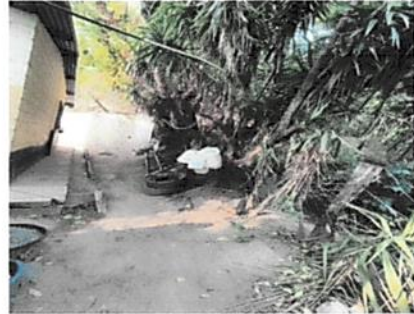
Foto 2: Se observa el muro es necesario darle continuidad para mantener un perímetro seguro en la escuela.