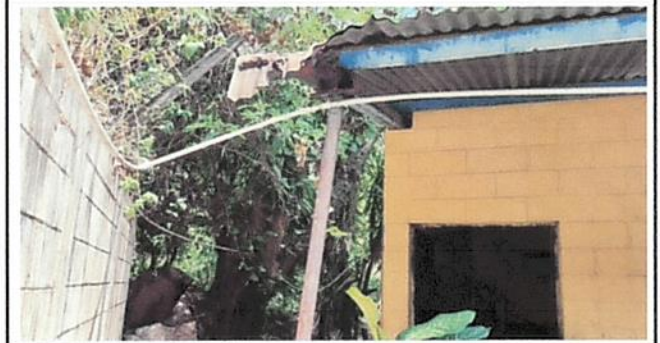
Foto 4: Se observa que la estructura metálica de esta parte de la escuela, está dañada y necesita reparación.